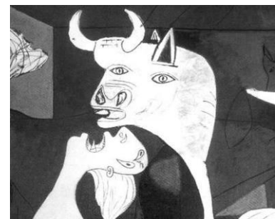
Detalle de Guernica, Pablo Picasso, 1937

Miguel Hernández (1910-1942), El hombre acecha (1938-1939)