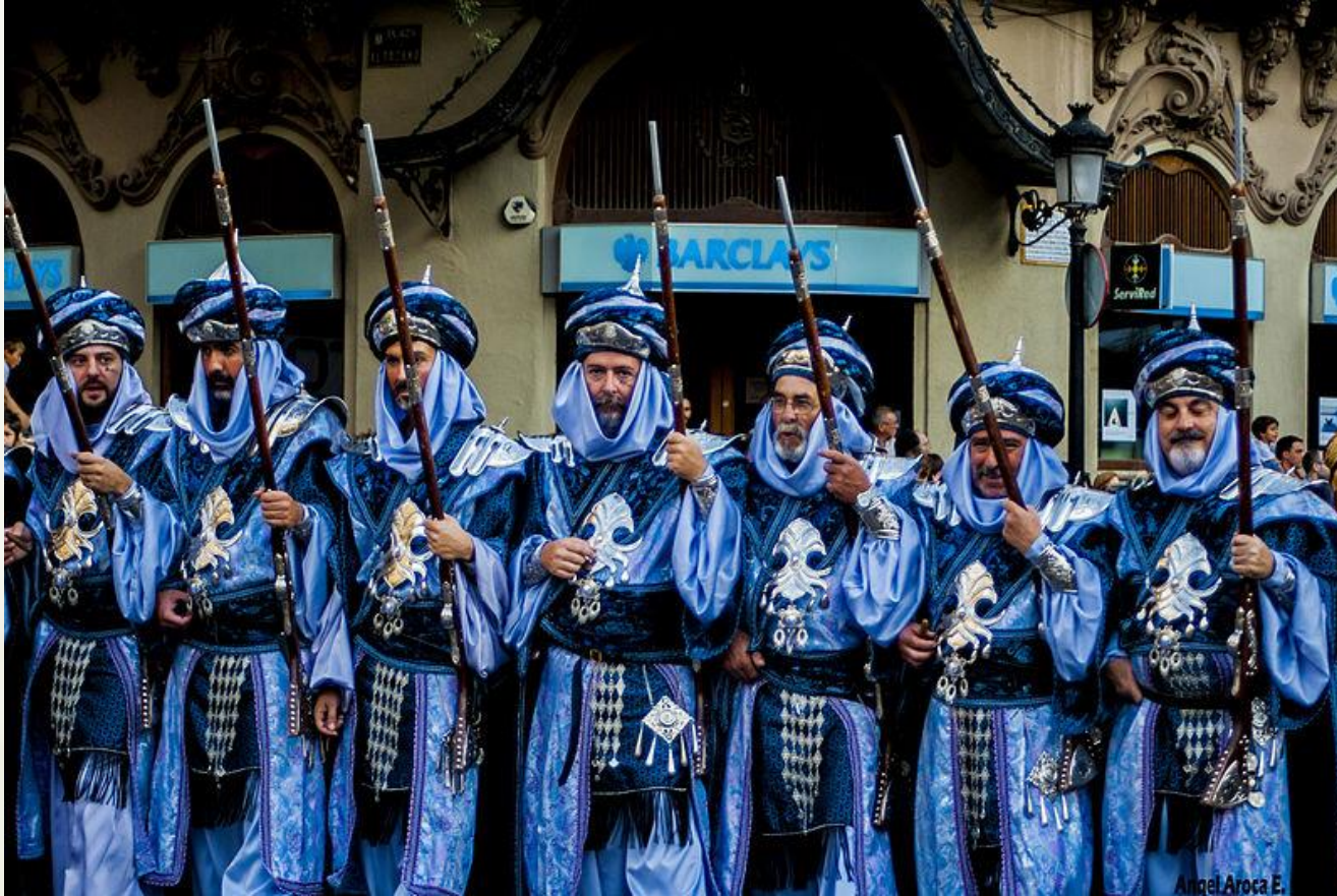
Moros en Albacete