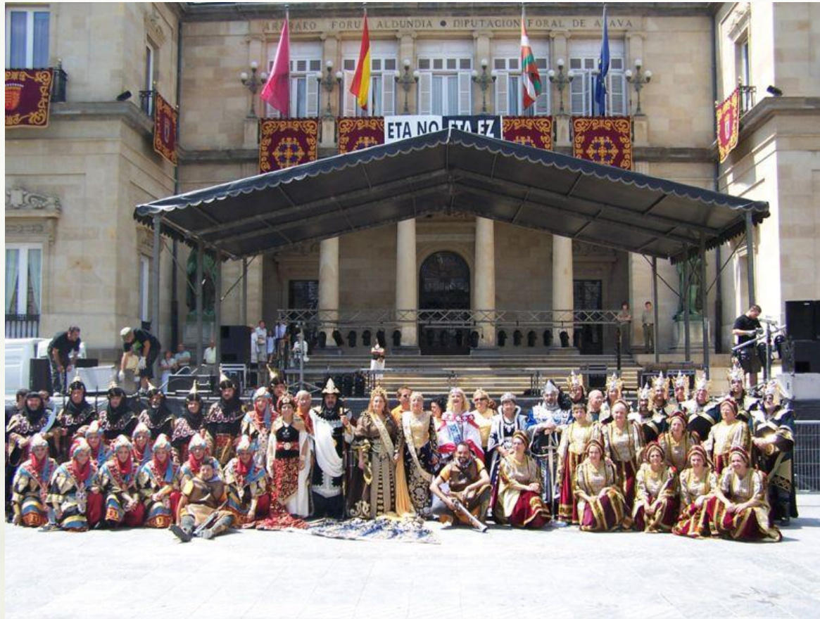
Fiestas de la Blanca en 2006 en Vitoria (País Vasco)