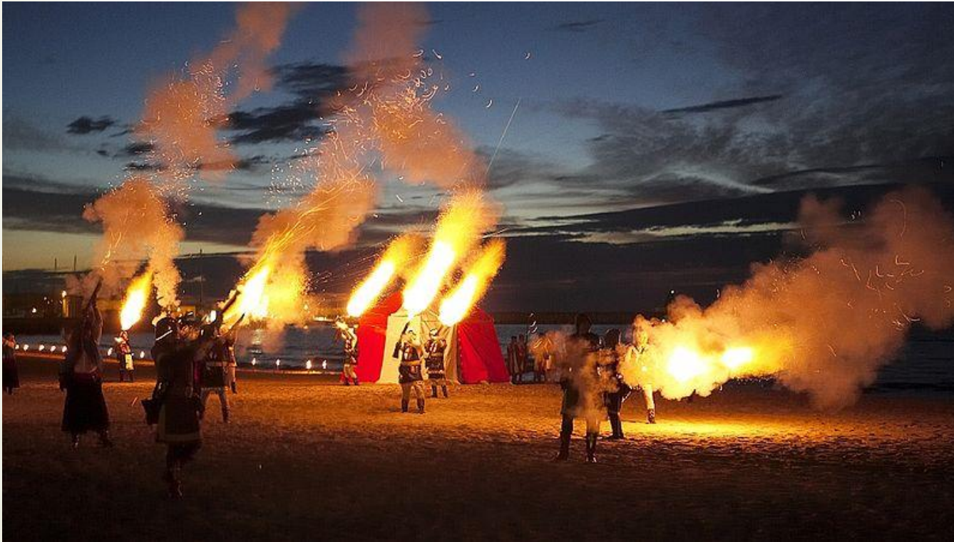
Desembarco de Campello (2006)