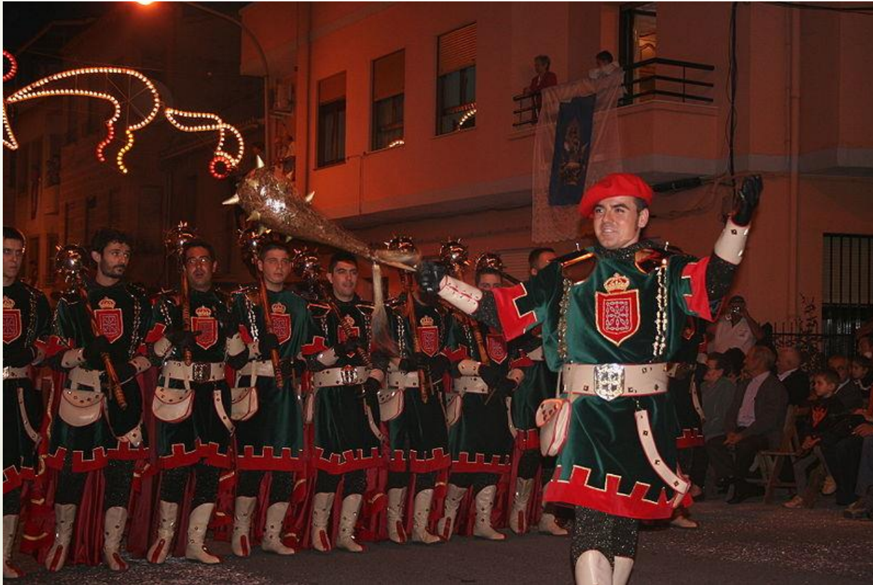
Fiesta de Moros y Cristianos en Callosa de Ensarriá (Alicante)