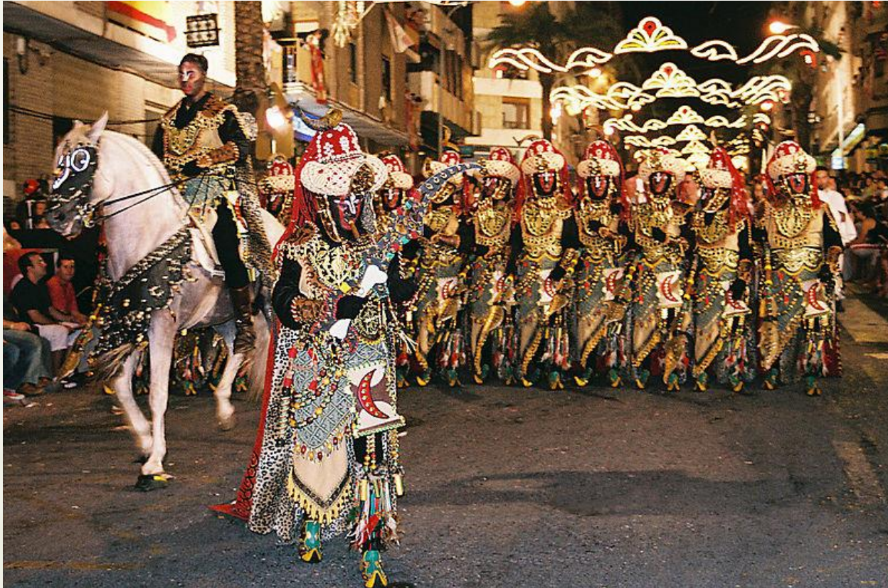
Escuadra de Negros, Capitanía de Kábilas de Onteniente (2005)