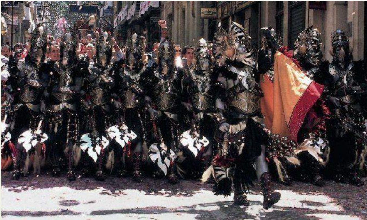
Escuadra de negres de la alferecía de la Filà Tomasinas en 2004, Alcoy