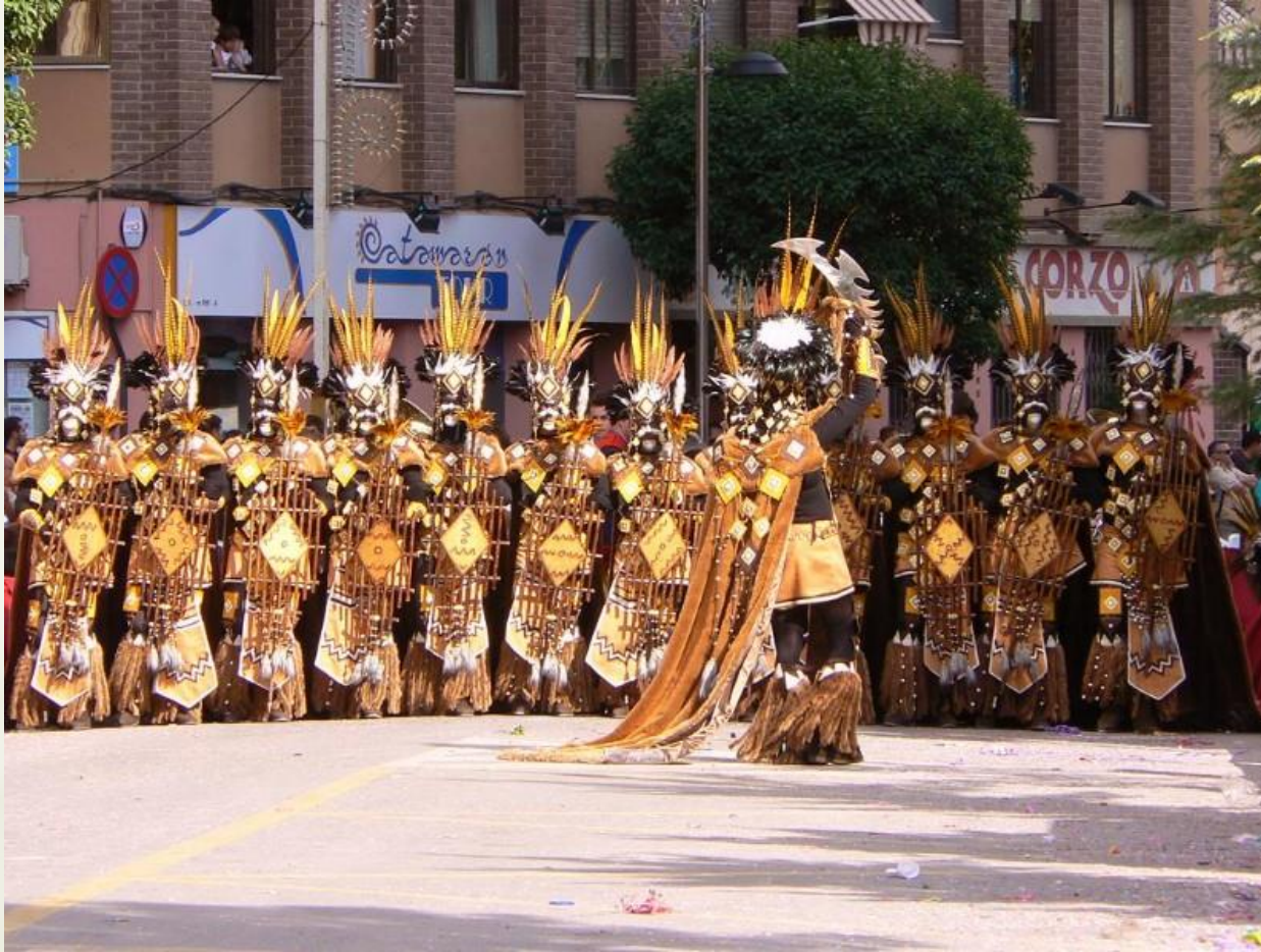
Escuadra de Zulúes (de la comparsa de Moros Nuevos) de Villena (2007)