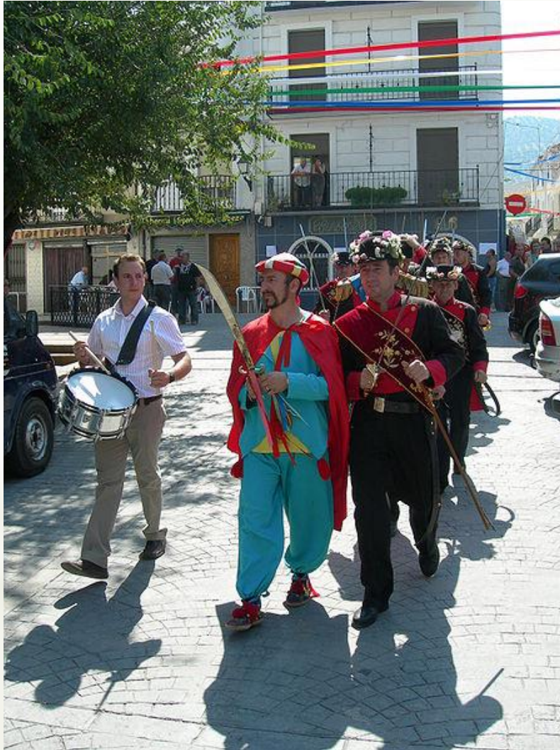
Fiesta de Moros y Cristianos de Campillo de Arenas (Jaén)